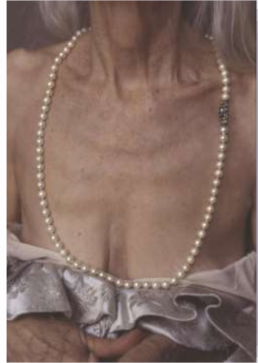
Diana Blok, Mother with Pearl Necklace, ed. 1 of 5 , 1997